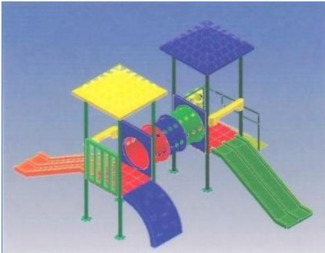
JUEGO DE PATIO GRANDE